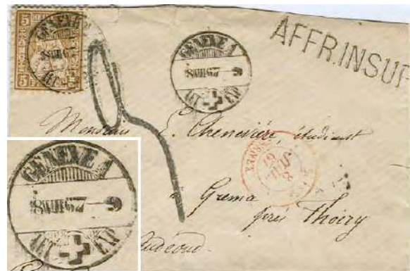
10.01 Lettre pour la France en rayon limitrophe (20 cts affranchie, 30 cts non affranchie). Taxe 30 cts – 5 cts présents = 25 cts, arrondie à 3 décimes (soit 30 cts).