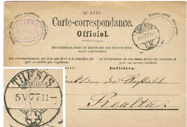
22.01 Carte officielle, en franchise de port.