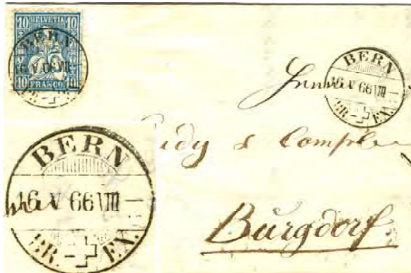
5.01 Lettre pour la Suisse. Premier jour connu pour ce type de cachet.