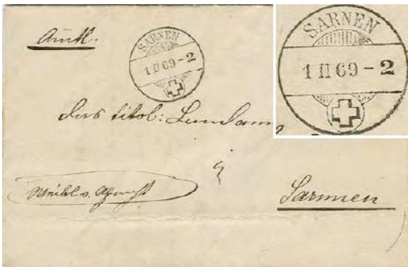
15.01 Lettre officielle en franchise de port.