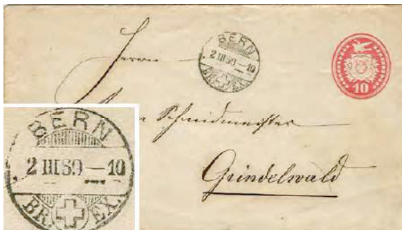
5.01a Successeur du 5.01: "BERN" écrit en caractères bâton conventionnels