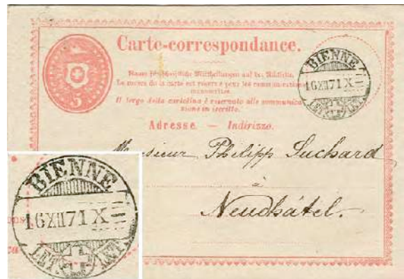
6.01 Carte postale.