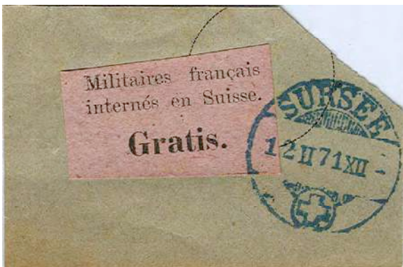
21.01 En bleu. Antidaté sur étiquette de franchise pour militaires français internés en Suisse.