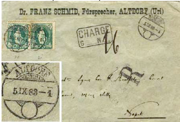
3.01a Lettre (25 cts) recommandée (25 cts) pour l'Italie. 50 cts. Pendant ses quinze derniers mois d'utilisation, le cachet de Altdorf apparaît sans croix dans le cercle.