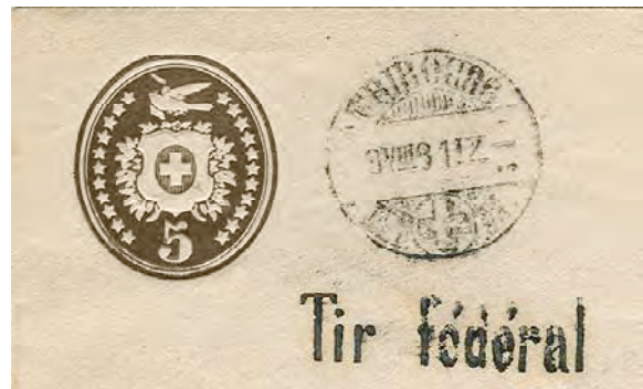
9.01 Entier. Cachet du "Tir fédéral".