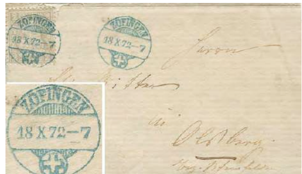
25.01 En bleu, sur imprimé.