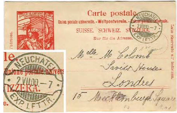
9.01 Entier UPU (10 cts) pour l'Angleterre.