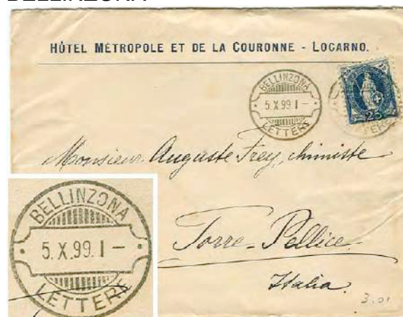
3.01 Lettre pour l'Italie. 25 cts.