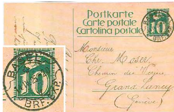
2.04 Carte postale pour Genève