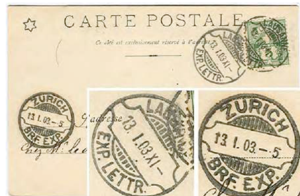
7.01a et 11.03 Carte postale de Lausanne pour Zürich, avec cachets en lame de rasoir au départ et à l'arrivée.