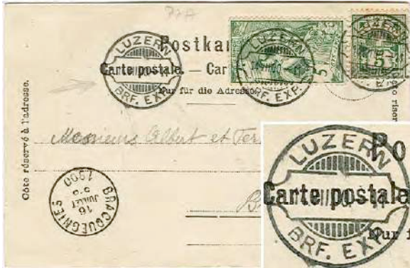
8.01 Carte postale pour la Belgique (10 cts), avec affranchissement composé 65B et 77A.