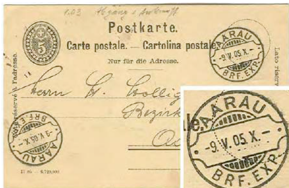
1.03 Carte postale en rayon local