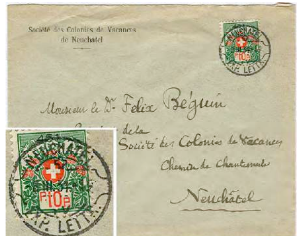
9.03 Lettre en rayon local (10 cts) avec timbre de franchise (Société des Colonies de Vacances de Neuchâtel, N° 451).