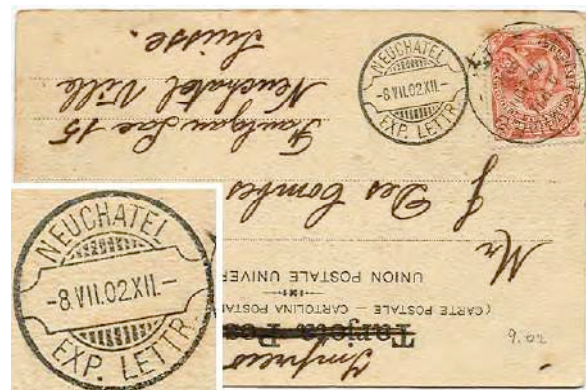
9.02 Carte de l'Uruguay, avec cachet d'arrivée de Neuchâtel.