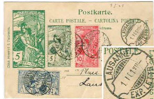
7.01 Carte suraffranchie avec la série UPU, du dernier jour de validité.