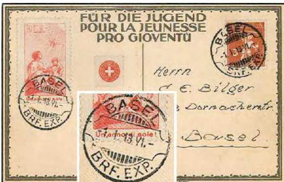
2.03 Carte postale pour Bâle avec un précurseur Pro Juventute en italien