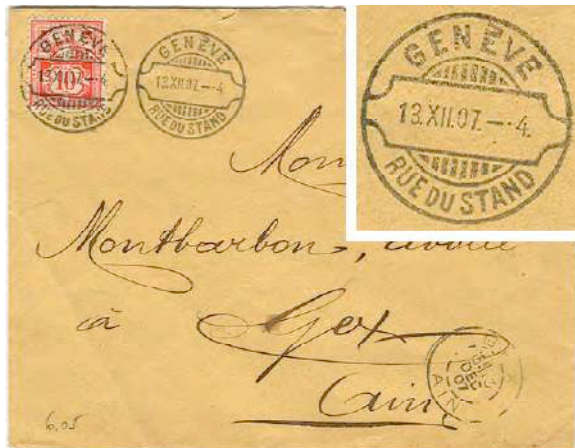
6.05 Lettre pour la France en rayon limitrophe (10 cts au lieu de 25 cts. Tarif du 1.10.1907).