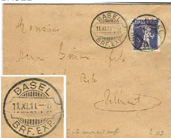
2.03 Daté du 11.XI.11-11