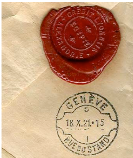
6.06 Lettre recommandée d'Egypte pour Genève, avec cachet d'arrivée au verso.