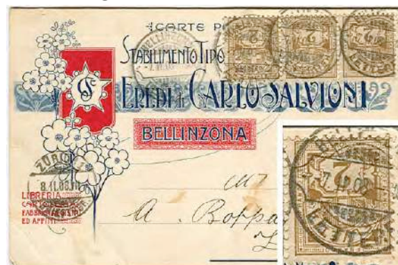
3.03 Carte postale pour Zürich (5 cts auraient suffi).