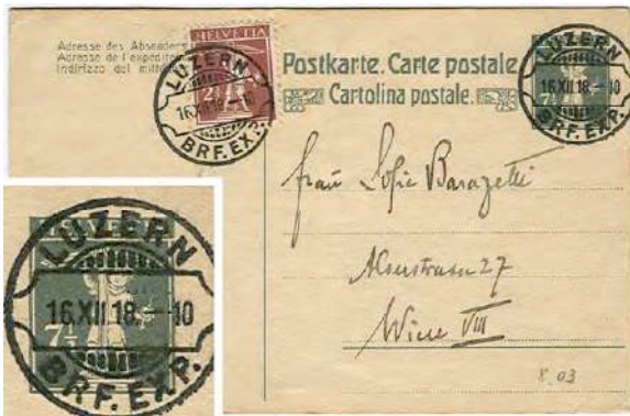
8.03 Carte postale pour l'Autriche (10 cts).