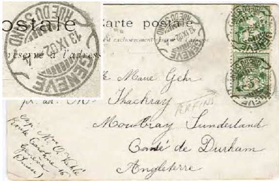
6.04 Carte postale pour l'Angleterre, affranchie avec des timbres perforés "C L" (Crédit Lyonnais).